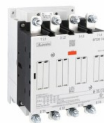
Stycznik mocy BF230