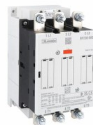
Stycznik mocy BF230