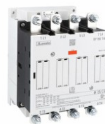
Stycznik mocy BF195