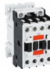
Stycznik mocy BF18