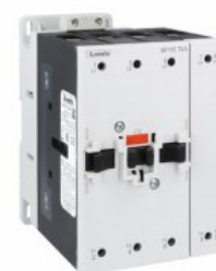
Stycznik mocy BF115