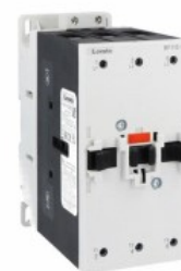
Stycznik mocy BF115