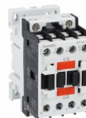
Stycznik mocy BF09