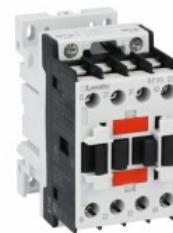
Stycznik pomocniczy BF00