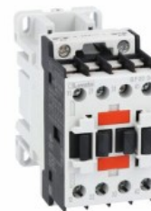
Stycznik pomocniczy BF00