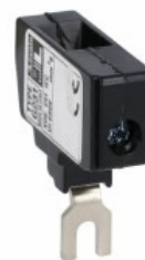
Zacisk powiększający, jedno-półowy. 1x6 mm 2 do BF09... BF25 11G231