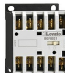
Stycznik mocy BGF09