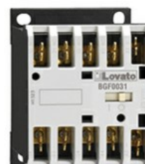
Stycznik pomocniczy BGF00