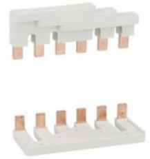
Conessioni rigide 3P per BF95...BF150 BFX3401