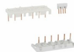
Conessioni rigide per avviatori stella-triangolo. Per BF26...BF38 BFX3231