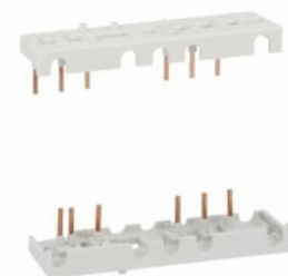
Conessioni rigide 3P per BF09...BF25 BFX3102