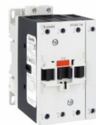
Contattore di potenza BFD80