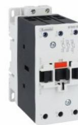
Contattore di potenza BFD65