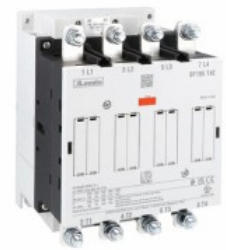
Contattore di potenza BF195