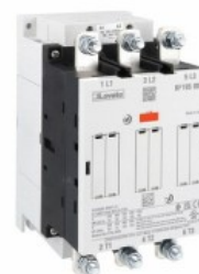
Contattore di potenza BF195