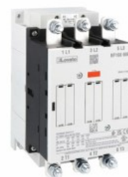
Contattore di potenza BF160