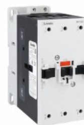
Contattore di potenza BF150