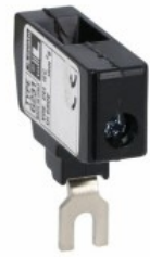
Attacchi maggiorati unipolari. 1x6mm 2 per BF09...BF25 11G231