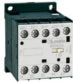
Contattore ausiliario BG00