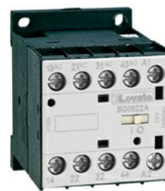
Contattore ausiliario BG00