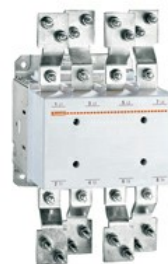
Contattore di potenza B6301000