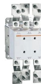
Contattore di potenza B6301000