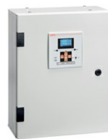
Układ SZR w obudowie ze sterownikiem ATL600 i 4-półowymi stycznikami, 100 A ATP