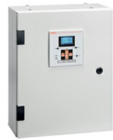
Quadri di commutazione ATS, con commutatore ATL600 e contattori quadripolari, 125A ATP