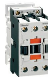
Contattore di potenza BF32