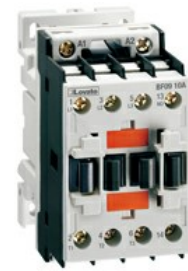
Contattore di potenza BF25