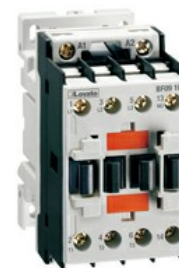
Contattore di potenza BF18