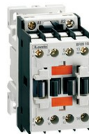
Contattore di potenza BF12