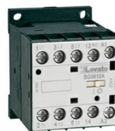
Contattore di potenza BG09