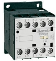
Contattore di potenza BG09